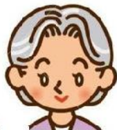
die G roßeltern